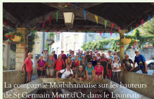
La compagnie Morbihannaise sur les hauteurs de St Germain Mont d'Or dans le Lyonnais