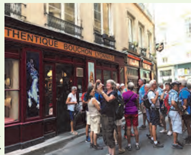
Pas de Lyon sans bouchon

Nous retrouvons ce parc magnifique qui avait enchanté les participants à la fête des lumières, il y deux saisons déjà, et ce vieux manoir dont la vétusté ne lui laissera bientôt guère de charme. Les guides sont à la hauteur et le samedi, la visite commune de Lyon et de ses traboules aura enchanté ces « géminés » si habitués à la cohabitation. Un bouchon lyonnais bien-sûr après un théâtre romain, Fourvière et sa cathédrale pour terminer sur l'avenue de La Croix Rousse si prisée des Canuts* jadis. Des façades en trompe l'œil pour tous et un musée pour nos touristes. Cette courte étape laissera, malgré tout, des bons souvenirs.