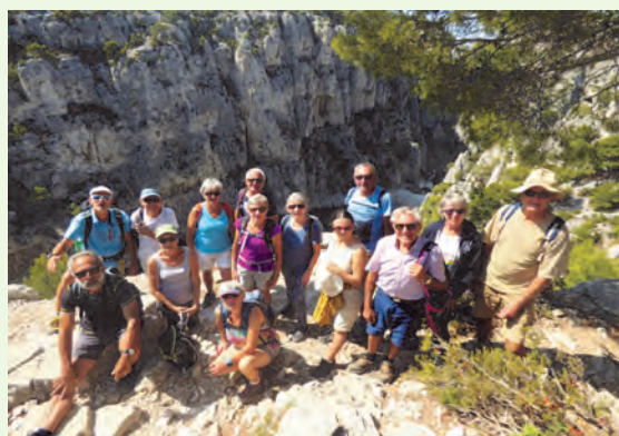
Les costauds dans les calanques de Cassis.

Vous avez dit Luberon, c'est bien là notre destination, la compagnie des guides rendra notre séjour fort agréable, des randos accessibles, un programme commun sur trois journées entre les Baux de Provence, la ville de Marseille et ses calanques, au large en bateau, et pour finir en beauté les sites d'Aubagne et de Cassis. A Cereste entre Drôme et Provence, la restauration était au top, le personnel du centre fort accueillant et les locaux fort convenables, tout était rentré dans l'ordre. Des souvenirs encore et encore de quoi affirmer que la vie est un fleuve tranquille.