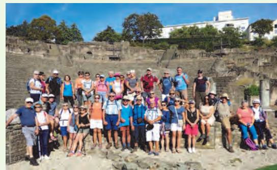
Ils sont fous ces romains !