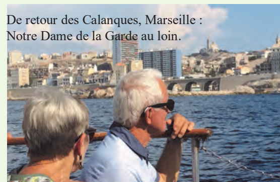
De retour des Calanques, Marseille : Notre Dame de la Garde au loin.