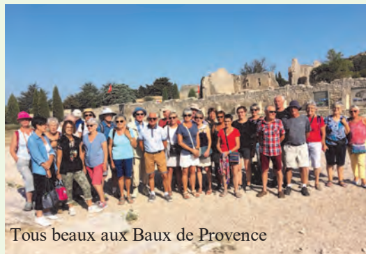
Tous beaux aux Baux de Provence