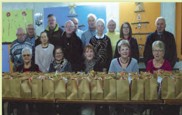
Une partie des bénévoles de Lorient et de Pontivy