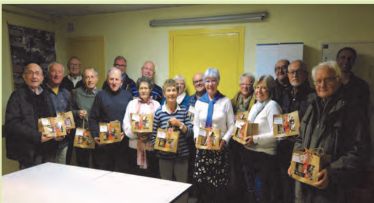
Une partie des bénévoles de Vannes et de Ploërmel